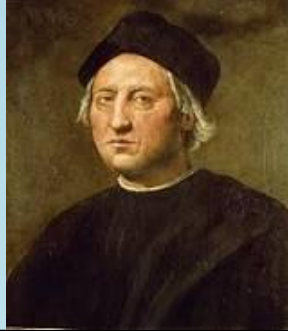
Christoph Kolumbus, Geboren: 1451 in Italien, Genua