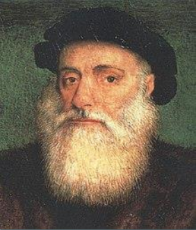
Vasco Da Gama, Geboren: 1469 in Portugal, Sines