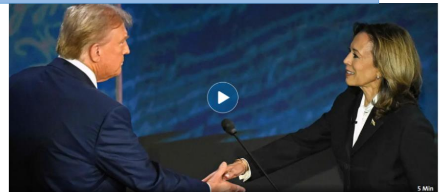
INTERVIEW TV-Duell im US-Wahlkampf